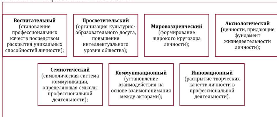
Рис. 3. Факторы взаимовлияния культуры на социально-экономическое развитие территории

Для систематизации концептуального осмысления влияния культуры на социально-экономическое развитие малого города можно привести следующие факторы (см. рис. 3).